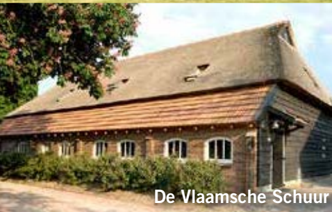
De Vlaamsche Schuur