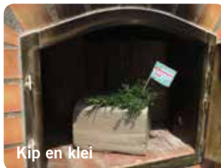
Kip en klei

Om 17.00 uur op de voormalige leerfabriek KVL, Almystraat 14 . Trek makkelijke schoenen aan; niet geschikt voor mensen die slecht ter been zijn.