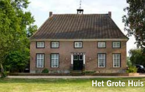
Het Grote Huis